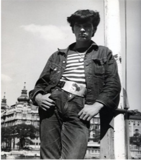
Die Halbstarken brachten Unruhe in die ruhige Limmatstadt.

Während alle anderen sich vor ihnen fürchteten, feierte er mit ihnen Weihnachten. Wenn die Polizei sie suchte, versteckte er sie in seiner Wohnung: Karlheinz Weinberger, der Fotograf der Zürcher «Halbstarken».